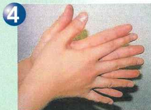
④指の間を十分に洗う。