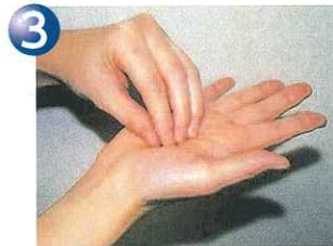
③指先、爪の間をよく洗う。