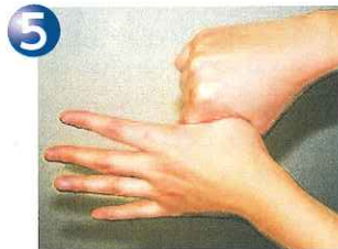
⑤親指と手掌をねじり洗う。