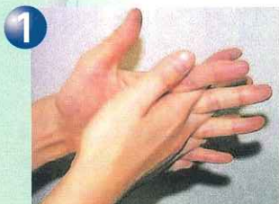
①手の甲を合わせ、よく洗う。